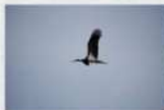
Encinas, retamas y grandes berrocales hacen de esta zona un enclave idóneo para la nidificación y visita obligada de aves como buitras, alimochas y cigüeña negra.