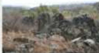
Dolmen del Pibar, del Labrao, del Alisar, Los Murcias, El Morquillo y el del Gambute, nos acompañaran a lo largo de la senda. Ruinas recordatorias de numerosos pueblos prehistóricos atraídos por el frescor del agua de los ríos y la flora y fauna de la zona.