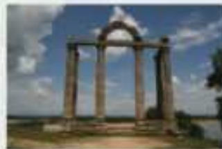
Las Mármolas, convertidos en atalaya de todo este enclave natural, y vestigio del pueblo de Talavera la Vieja, bajo las aguas del embalse.