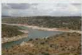
La singularidad de esta senda es la belleza natural del encuentro fluvial del Rio Ibor con el Rio Tago, paraje conocido como el Pibar.